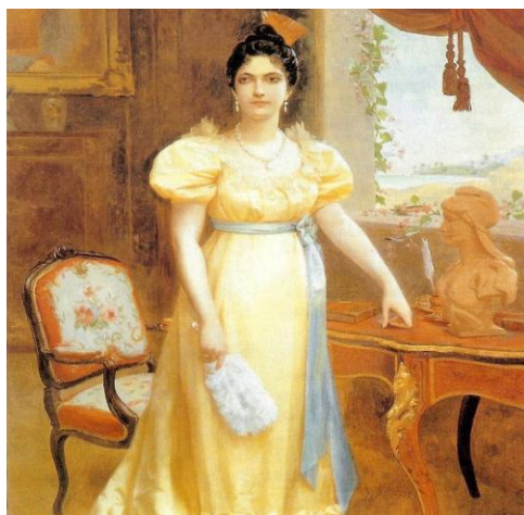
Fig.6. Luisa Cáceres de Arismendi

Luisa y Juan Bautista se conocen en la fiesta de navidad en la casa del General José Félix Ribas en 1814. Al poco tiempo el general les hace saber a los Cáceres sus intenciones matrimoniales, pero es rechazado debido a la juventud de Luisa (15 años) y la edad de él, 39 años (31,32) El 4 de diciembre del siguiente año se casan y se establecen en la parroquia Villa del Norte o Santa Ana, un pueblo entre La Asunción y Juan Griego (31,32) Su hermano Félix es ejecutado por Francisco Rosete en Ocumare, lugar donde por primera vez entran los realistas dentro de una iglesia el 11 de febrero de 1814. El padre de Luisa muere fusilado el 16 de marzo de 1814.